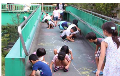
▲ 落書き大会で盛り上がり